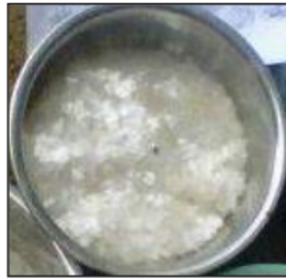
Gambar 3.5 Cacah Plastik

Cacah Plastik yang digunakan mempunyai diameter maksimum 5,00 mm. Bahan campuran cacah plastik merupakan limbah dari cangkir air mineral. Bahan campuran digunakan sebagai bahan tambah terhadap berat semen dengan kadar 1%, 2,5%, dan 5%.