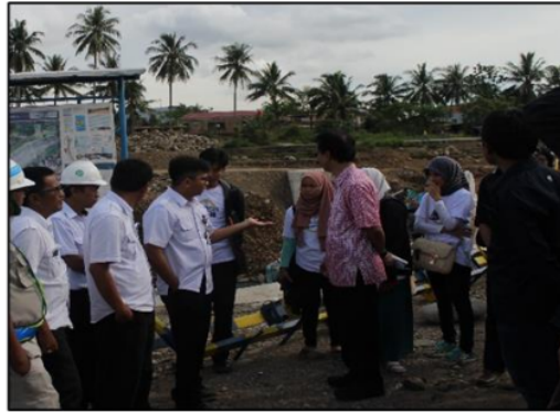
Gambar 4.2. Praktek pembuatan conblock

Dalam tahap ini ditunjukkan bagaimana proses pencampuran antara bahan-bahan yang diperlukan sesuai dengan takaran yang sudah diuji sebelumnya sehingga tercampur menjadi bahan yang solid dan dicetak berbentuk persegi panjang dengan ukuran 5cm x 10 cm x 20 cm. Semua peserta mengikuti dan praktek langsung bagaimana cara agar conblock yang di cetak harus memiliki permukaan yang rata, tidak terdapat retak-retak dan cacat. Metode yang digunakan adalah metode perawatan air ( water curing ) yang bertujuan untuk menjaga agar tidak terjadi evaporasi berlebihan pada saat conblock masih dalam keadaan plastis yang dapat menimbulkan retakan pada permukaan conblock serta dapat menjamin tercapainya kekuatan tekan yang diinginkan.