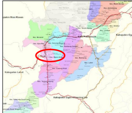
Gambar 3.2. Lokasi Penelitian

Penelitian ini dilakukan di Jl. Karet Desa Air Lintang Kabupaten Muara Enim Sumatera Selatan dengan melibatkan pemerintah Kabupaten dan masyarakat sekitar