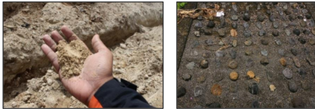
Gambar 4.3 Penyiapan bahan dasar