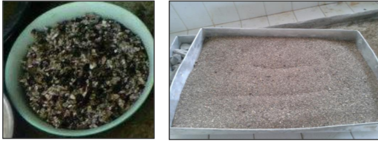
Gambar 3.4 Limbah Karet