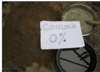
Gambar 3.5 Pencetakan Conblock

Cetakan yang digunakan berbentuk persegi panjang dengan ukuran 5cm x 10cm x 20cm. Setelah adukan campuran telah siap, kemudian dicetak pada cetakan conblock secara manual.