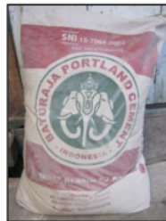
Gambar 3.3 Semen yang digunakan pada penelitian

Semen yang digunakan jenis PC I produksi PT. Baturaja dengan perbandingan 1:4. Semen ini dikemas dalam kantong kertas dengan berat 50 kg/zak.