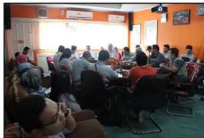
Gambar 4.2 Pemaparan Materi

Pada tahap kedua ini dilakukan pemaparan materi/sosialisasi, praktek pembuatan contoh benda uji dan diskusi. Tahap sosialisasi ini yaitu mengadakan pertemuan yang dihadiri oleh wakil pemerintah Kabupaten Muara Enim dan masyarakat untuk pemaparan materi tentang conblock dan sisa limbah karet. Pada tahap ini para peserta antusias karena materi yang dipaparkan merupakan hal yang baru dan sangat berguna bagi masyarakat petani karet yang terganggu dengan sisa limbah produksi karet. Pertanyaan paling banyak adalah mengenai bagaimana perlakuan sisa limbah karet agar bisa menjadi bahan dasar campuran conlock, apakah manfaat yang paling signifikan apabila menggunakan conblock tersebut, serta apa perbedaan conblock berbahan dasar sisa limbah karet dengan conblock konvensional. Pada tahap ini merupakan tahap yang krusial karena bertujuan untuk mengedukasi masyarakat bahwa sisa limbah karet juga dapat digunakan sebagai bahan material ramah lingkungan.