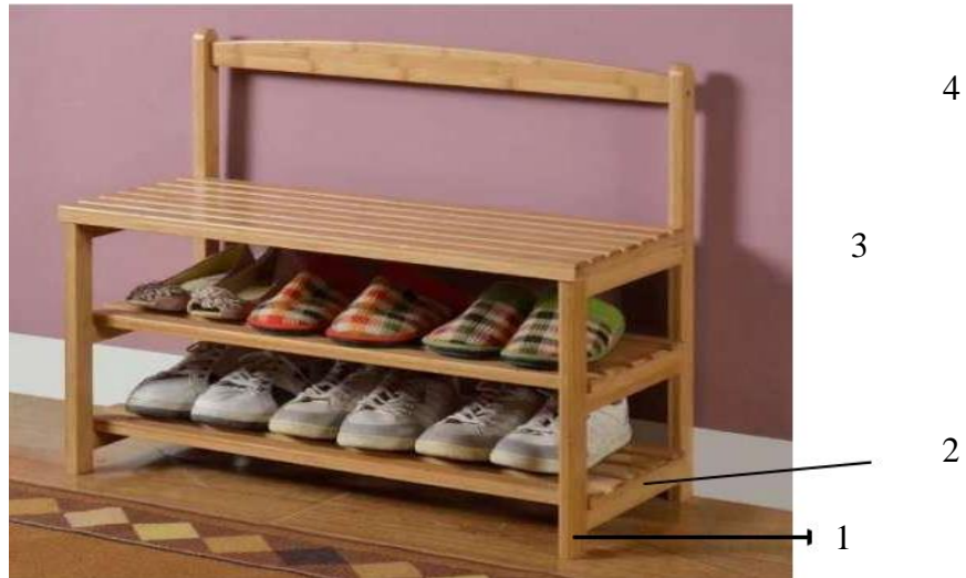
Gambar 2.1.1 Produk Rak Sepatu