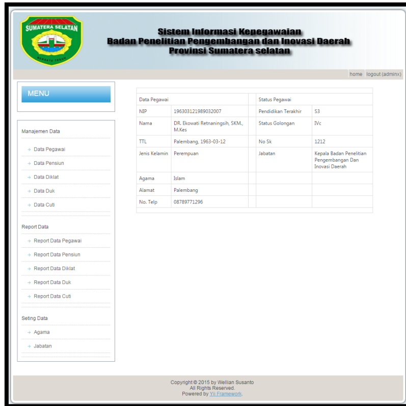
Gambar 2. Halaman Data Pegawai

data pegawai, fungsi update berfungsi untuk melakukan perubahan data pegawai yang sudah ada, fungsi delete adalah untuk menghapus data pegawai yang sudah ada (gambar 2).