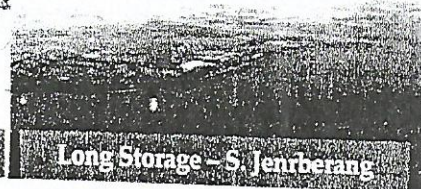
Long Storage - S. Jenberang