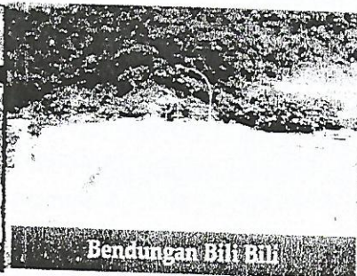
Bendungan Bili Bili