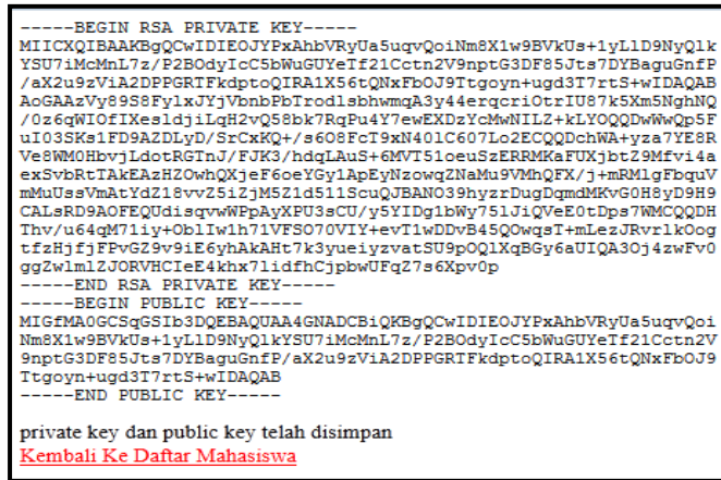
Gambar 4. Hasil Generate Sepasang Kunci RSA dengan Panjang 1024 Bit

Dengan menggunakan perintah tersebut akan menghasilkan kunci RSA seperti yang ditunjukkan pada Gambar 4.