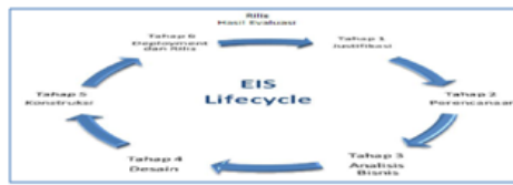
Gambar 1: Metodologi Penelitian