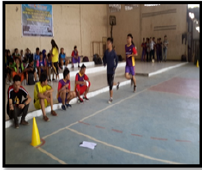
Gambar 7: Uji t Nilai Beda Pretest dan Posttest