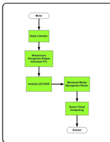
Gambar 1: Kerangka Penelitian