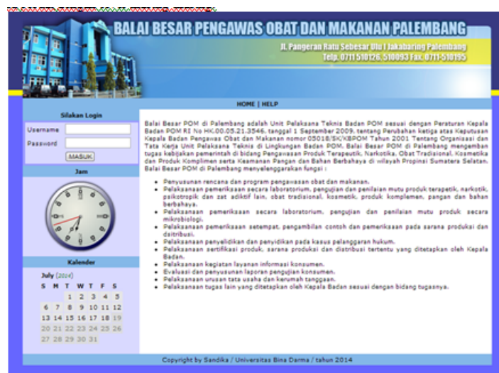
Gambar 2: Halaman Login