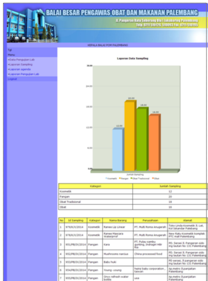
Gambar 5: Halaman Laporan Sampling