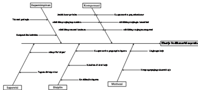
Gambar 6: Fishbone Diagram Faktor yang Mempengaruhi Kinerja FM

Jika dijabarkan dalam bentuk fishbone diagram atau cause and effect diagram maka akan tampak seperti gambar di bawah ini.