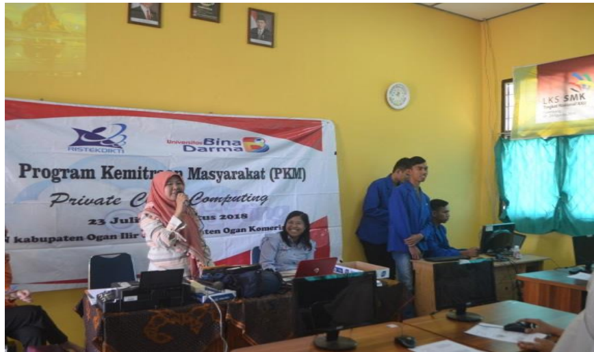
Gambar 3. Kegiatan Ujicoba Layanan Private Cloud Computing

Sistem layanan private cloud computing yang telah dirancang dan dibangun akan dilakukan uji coba kelayakan sistem pada mitra sekolah. Uji coba yang dilakukan pada SMK Negeri 1 Kayuagung berjalan dengan baik, dimana guru dan siswa sangat antusias dalam mengikuti kegiatan Program Kemitraan Masyarakat (PKM) yang bertema tentang layanan private cloud computing dengan sistem nextcloud , siswa dan siswi sangat cepat memahami dalam menggunakan sistem nextcloud yang telah di implementasikan pada jaringan laboratorium komputer sekolah, sehingga uji coba sistem layanan private cloud computing pada mitra sekolah dilakukan dengan sukses di laboratorium komputer sekolah.