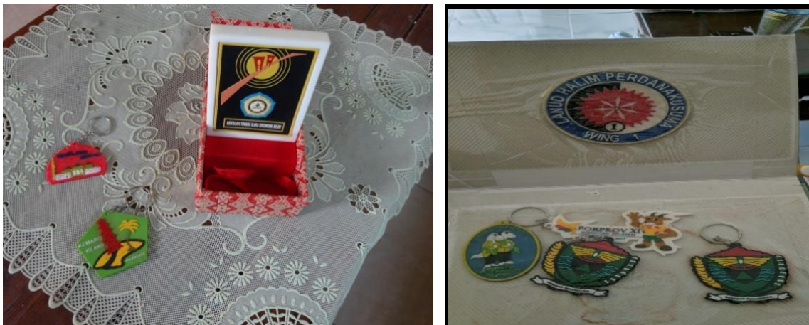
Gambar 2. Souvenir Berbahan Karet Hasil Produksi UMKM Mitra

Dari hasil penelitian Fachry dkk (2012), latex olahan yang menghasilkan produk berupa souvenir dengan kualitas produk terbaik berasal dari lateks dengan penambahan filler (kaolin) 30Y6 berat, dan suhu vulkanisasi 100-110 °C.