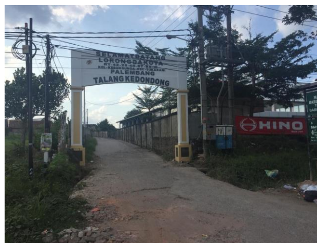
Gambar 1. Pintu Masuk Sentra Kerajinan Berbahan Baku Karet

Bahan utama yang digunakan dalam kerajinan ini adalah lateks dan pewarna. Bahan pembantu yang digunakan masih sangat sederhana seperti seperti, kompor, cetakan, panci, dan penetes latek.