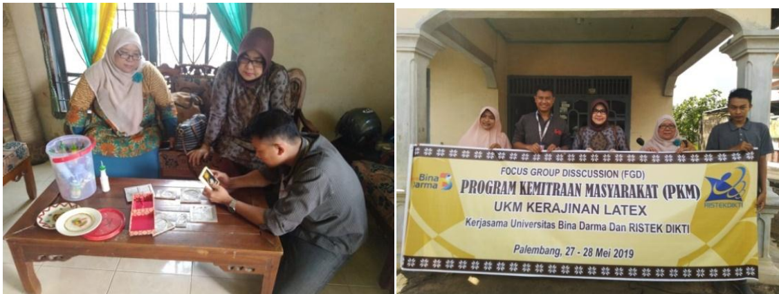
Gambar 3. Kunjungan dan Focus Group Discussion dengan UMKM Mitra

Kunjungan ke UKM latex untuk mengetahui masalah yang dihadapi oleh UMKM (Gambar 3). Dari kunjungan ini didapatkan bahwa UKM ini sudah hampir 1 tahun selepas dari event ASIAN GAMES 2018 tidak lagi memproduksi souvenir karena kekurangan tenaga pengrajin, kesulitan pemasaran, dan kesulitan bahan baku.