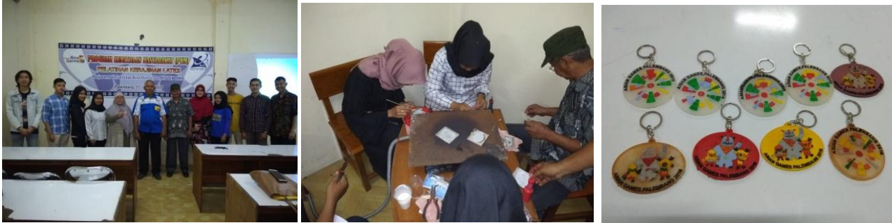
Gambar 5. Pelatihan Kerajinan Latex dan Hasil Kerajinan