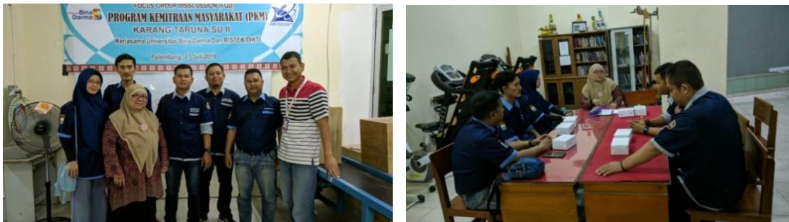
Gambar 6. FGD dengan Karang Taruna SU II

Sebagai upaya penumbuhan UKM latex yang baru, kami menggandeng Karang Taruna SU II yang berada di sekitar Kampus Universitas Bina Darma. Kerjasama yang disepakati adalah saling menumbuhkan UKM latex dan memberikan kontribusi terhadap kegiatan karang taruna yang baru saja diaktifkan kembali setelah lama mati suri (Gambar 6).