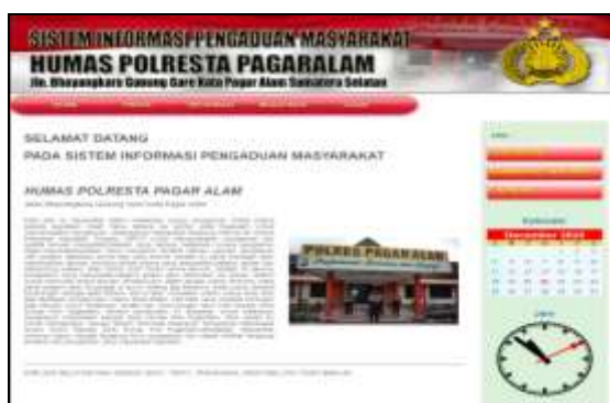
Gambar 2. Utama Sistem Informasi

Sesuai dengan Gambar 1 maka dapat diketahui bahwa terdapat dua jenis pengguna dari sistem informasi pelaporan pengaduan yaitu pelapor dan admin dari sistem informasi. pelapor dapat melakukan berbagai hal seperti melengkapi data diri sebagai pelapor, melakukan laporan dan melihat proses atau kemajuan dari laporan. Sedangkan admin dapat melihat laporan masuk serta melakukan perubahan status pelaporan. Gambar 2 merupakan tampilan utama dari sistem informasi pelaporan pengaduan.