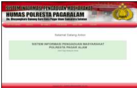
Gambar 6. Halaman Pelapor

Setelah melakukan proses registrasi seperti yang diperlihatkan pada Gambar 5 maka barula pelapor atau masyarakat dapat melakukan login dan akan ditampilkan halaman khusus pelapor seperti yang diperlihatkan pada Gambar 6.