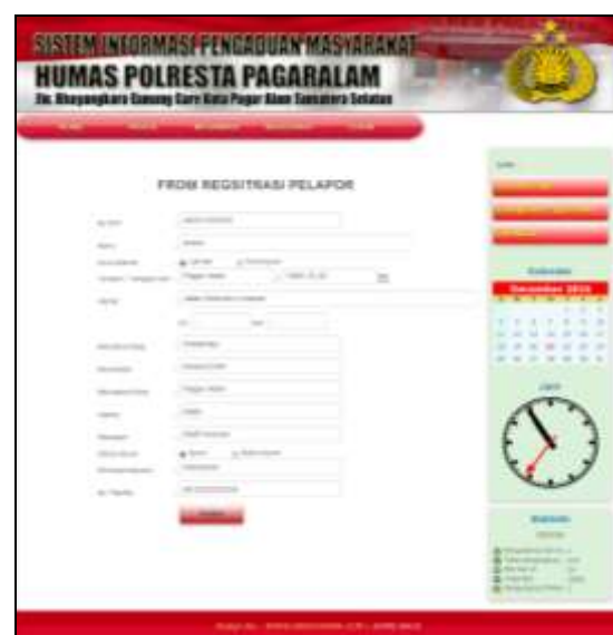
Gambar 5. Form Registrasi Pelapor

Untuk melakukan pelaporan maka masyarakat harus melakukan registrasi sebagai pelapor dengan cara mengklik menu register. Selanjutnya masyarakat diminta untuk melakukan pengisian data pribadi sebagai bentuk validasi dan menjamin kebenaran dari laporan yang diberikan oleh masyarakat. Gambar 4 merupakan tampilan dari proses registrasi yang dapat dilakukan oleh masyarakat pada sistem informasi pelaporan. Data yang dimasukkan antara lain adalah nomor KTP, alamat, pekerjaan, kewarganegaraan dan juga nomor telepon.