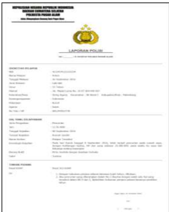
Gambar 10. Detail Laporan Masuk

Dari semua bentuk sistem informasi yang dihasilkan seperti yang diperlihatkan pada Gambar 2 sampai dengan Gambar 10 maka proses pembentukan sistem infromasi dilakukan menggunakan model view controller (MVC) dengan menerapkan framework CodeIgniter (CI) . Untuk itu salah satu proses pembentukan tersebut seperti yang diplerlihatkan pada Gambar 11.