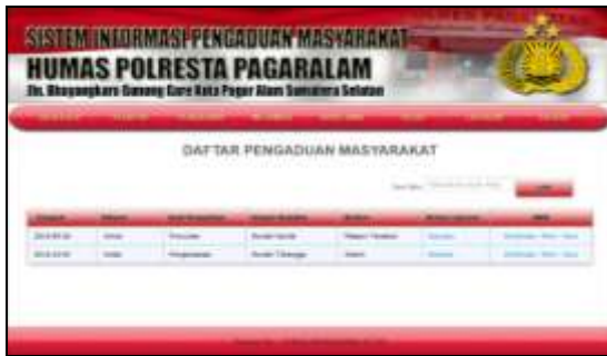
Gambar 9. Daftar Pengaduan

Untuk melihat detail paleporan maka dapat dilihat dari link view sedangkan untuk menerima laporan dapat dilakukan denan klik konfirmasi. Detail laporan masuk seperti pada Gambar 10.