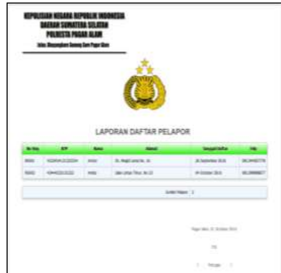
Gambar 10. Laporan Data Pengaduan

Untuk melihat detail paleporan maka dapat dilihat dari link view sedangkan untuk menerima laporan dapat dilakukan denan klik konfirmasi. Detail laporan masuk seperti pada Gambar 10.