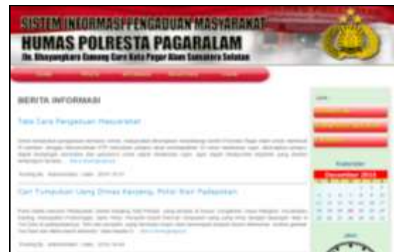
Gambar 3. Informasi bagi masyarakat

Selain itu juga pada halaman utama juga terdapat informasi yang berkaitan dengan kejadian dan atau berita yang dapat dilihat oleh pengunjung baik itu masyarakat atau mereka yang ingin melakukan pelaporan. Pada halaman utama juga dapat dilihat informasi tata cara penggunaan sistem informasi pelaporan pengaduan seperti yang diperlihatkan pada Gambar 3.