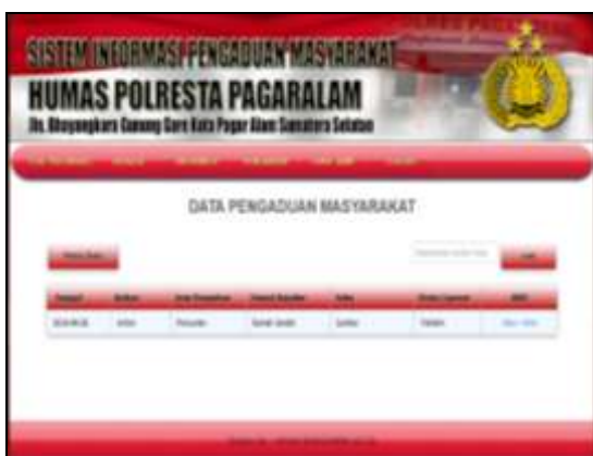
Gambar 7. Informasi Pengaduan

Seperti yang diperlihatkan pada Gambar 6 maka dapat diketahui bahwa terdapat beberapa menu yang dapat diakses diantaranya adalah menu biodata pelapor, informasi, pengaduan, buku tamu dan logout . Untuk melakukan pengaduan maka pelapor dapat mengklik menu pengaduan maka akan ditampilkan informasi pengaduan seperti yang dipelihatkan pada Gambar 7.