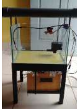
Gambar 2 Alat prototype akuaponik