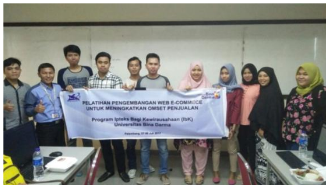
Gambar 2. Produk Web E-commerce Tenant dan Kegiatan Pelatihan E-Commerce

ini sudah memiliki blog untuk promosi usaha meraka. Trainer atau narasumber pada pelatihan ini adalah mitra IbK yang merupakan tenaga IT yaitu Bpk. Usman Ependi, M.Kom dan juga memiliki usaha dalam bidang jasa pembuatan website dan program. Acara ini diadakan di laboratorium komputer Lantai 7 Kampus Utama Universitas Bina Darma Jl. A.Yani no. 3 Palembang.