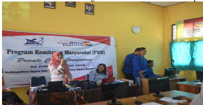
Gambar 3. Kegiatan Ujicoba Layanan Private Cloud Computing

Sistem layanan private cloud computing yang telah dirancang dan dibangun akan dilakukan uji coba kelayakan sistem pada mitra sekolah. Uji coba yang dilakukan pada SMK Negeri 1 Kayuagung berjalan dengan baik, dimana guru dan siswa sangat antusias dalam mengikuti kegiatan Program Kemitraan Masyarakat (PKM) yang bertema tentang layanan private cloud computing dengan sistem nextcloud , siswa dan siswi sangat cepat memahami dalam menggunakan sistem nextcloud yang telah di implementasikan pada jaringan laboratorium komputer sekolah, sehingga uji coba sistem layanan private cloud computing pada mitra sekolah dilakukan dengan sukses di laboratorium komputer sekolah.