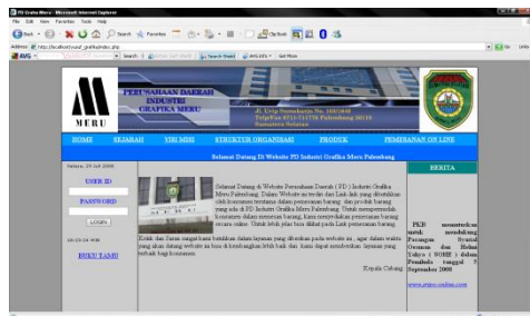
Gambar 4.1. Tampilan Home