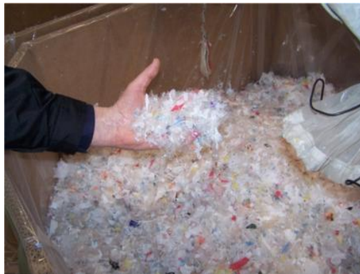
Gambar 1. bahan baku setelah dicacah

Dalam penelitian disiapkan bahan baku berupa sampah plastik khusus jenis poliethylen (HDPE) yang sudah dibersihkan dan dicacah dengan ukuran lebih kurang 1 cm, bahan ini kemudian dimasukkan dalam Tanki baja dan ditambahkan katalis Silica Alumina sebanyak 1,5% ( 60 gram ) dari bahan baku plastik yang dipakai, dengan proses pemanasan menggunakan bahan bakar LPG. Dari penelitian yang dilakukan oleh Ekki (2016), pengaruh suhu dan rato