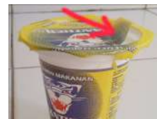
Gambar 2. Cacat Produk Seal Tidak Merekat Sempurna atau Cup Bocor

Objek penelitian adalah visual inspection task pada minuman kemasan cup merk "Panther" untuk mengidentifikasi cacat. Adapun karakteristik atau kategori cacat yaitu volume kurang (Vk), Cup bocor (Cb), Gambar tidak pas (Gtp).