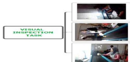
Gambar 7. Visual Inspection Task Pada Minuman Kemasan Panther