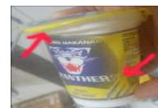
Gambar 3. Cacat Produk Volume Kurang