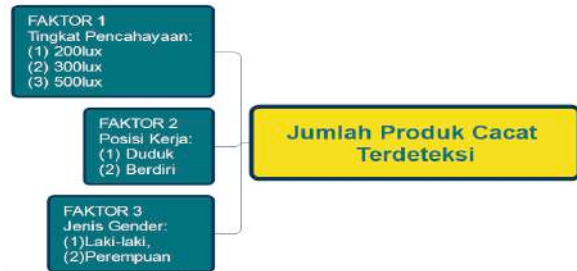
Gambar 5. Kerangka berpikir (variabel independen dan dependen)

gender laki-laki dan perempuan, nilai IQ 90-120 yang terlebih dahulu dilakukan test intelegensi umum (Azwar,2006), waktu pengamatan selama 2.20 jam. Desain eksperimen berjumlah 12 desain eksperimen yang merupakan manipulasi dari variabel independen, seperti yang tergambar pada gambar 5 berikut ini: