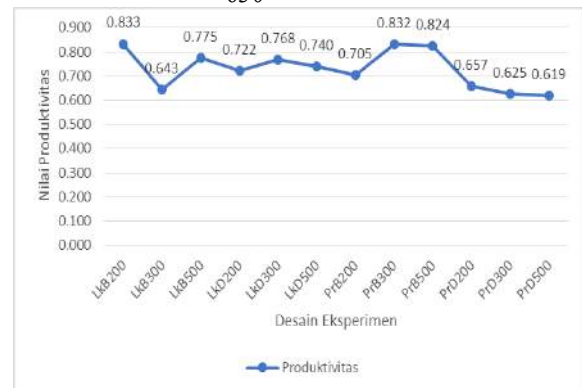
Gambar 8. Produktivitas Dari Visual Inspection Task

Berdasarkan nilai produktivitas tersebut, maka dapat disimpulkan bahwa 12 kelompok desain eksperimen penelitian belum memenuhi batasan standar produktivitas, dimana ditunjukkan dari line yang belum mencapai nilai 1. Namun, dari ke 12 kelompok desain eksperimen, desain eksperimen LkB200 merupakan desain eksperimen yang nilai produktivitasnya tertinggi yaitu 0.833. Oleh karena itu, faktor-faktor tersebut di atas besar artinya bagi penciptaan suasana kerja yang ergonomis, untuk menunjang tercapainya efisiensi di dalam proses yang telah memenuhi batasan standar produktivitas.