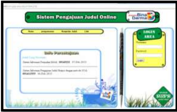
Gambar 1. Interface Halaman Utama

studi. Halaman utama terdapat form login yang terletak pada sisi sebelah kanan atas yang berfungsi sebagai tempat mahasiswa menginputkan username dan password untuk masuk kedalam sistem yang dapat dilihat pada gambar 1.