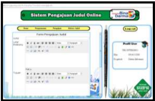
Gambar 2. Interface Pengajuan Judul

Gambar 2 merupakan halaman yang sangat penting pada sistem pengajuan judul ini. Karena disini mahasiswa menginputkan judul skripsi atau tugas akhir mereka serta mengupload jurnal sebagai bahan pendukung untuk memperkuat judul.