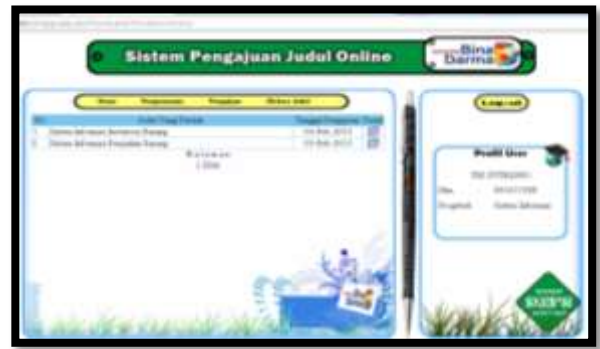
D. Halaman Cetak Judul

Halaman ini merupakan halaman tindak lanjut dari halaman utama mahasiswa ketika judul mahasiswa disetujui dan mahasiswa ingin mencetaknya. Halaman cetak judul dapat dilihat pada gambar 4.