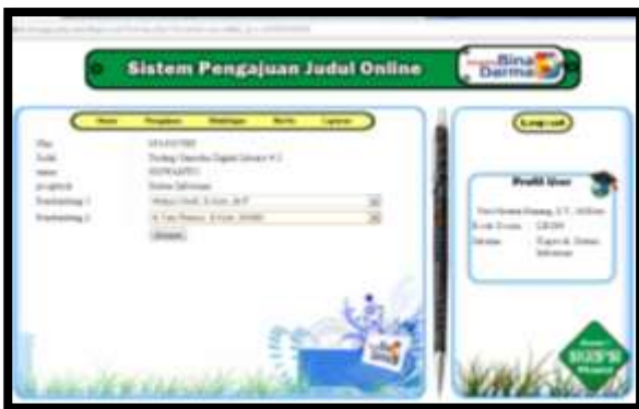
Gambar 7. Interface Penentuan Dosen Pembimbing

Pada gambar 7 menampilkan halaman pemberian dosen pembimbing. Dimana halaman ini merupakan halaman pemberian dosen pembimbing jika judul dari mahasiswa disetujui.