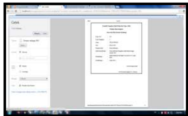
Gambar 5. Interface Cetak Persetujuan

Hasil cetak laporan merupakan output dari sistem pengajuan judul tugas akhir atau skripsi yang berisi kode acc, kode pengajuan, nama, nim, serta nama dosen pembimbing yang mendampingi mahasiswa. Halaman hasil cetak dapat dilihat pada gambar 5.