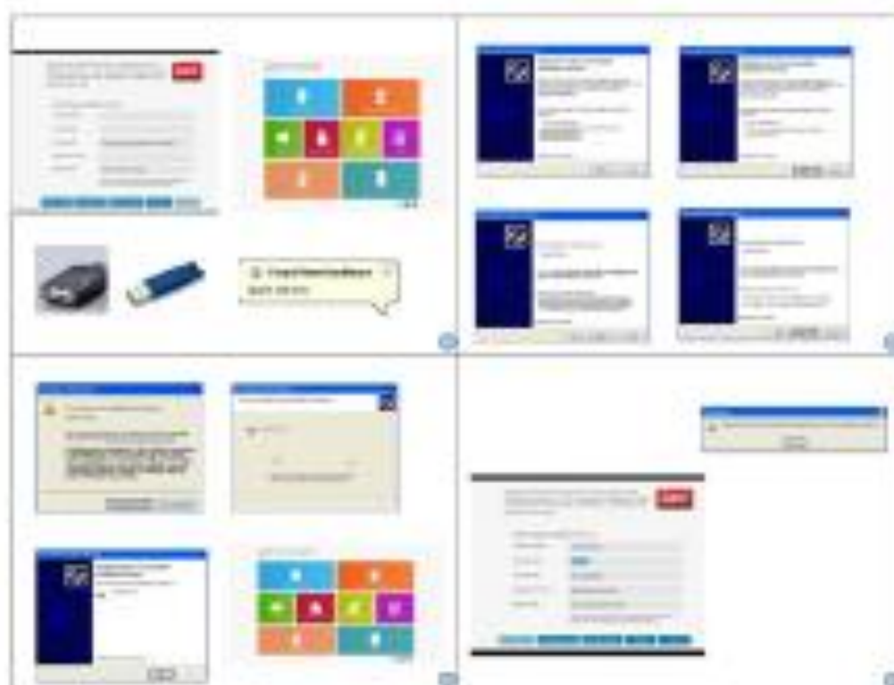
Gambar 4. Tampilan Instalasi Zahir Accounting

Pada gambar 3 dapat kita lihat langkah-langkah instalasi software zahir accounting. Sebelum mitra menggunakan software tersebut dalam menyusun laporan keuangan, terlebih dahulu dilakukan proses instalasi software zahir accounting. Setelah dilakukan instalasi, kegiatan selanjutnya adalah melakukan pelatihan penggunaan software tersebut terhadap mitra. Dengan adanya pelatihan ini maka mitra akan dapat langsung menggunakan software tersebut dalam penyusunan laporan keuangan.