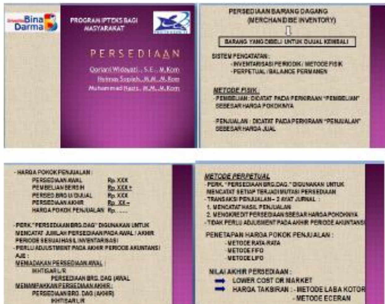
Gambar 3. Slide Persentasi Materi Pencatatan Persediaan

Materi ini berisi tentang bagaimana melakukan pencatatan persediaan barang, persediaan barang yang dimiliki oleh kedua mitra antara lain persediaan bahan baku kayu, cat, pennis dan lain-lain.