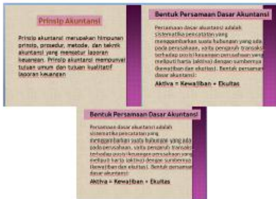
Gambar 1. Slide Persentasi Tentang Laporan keuangan

Materi tentang laporan keuangan ini berisi tentang bagaimana cara pembuatan laporan keuangan yang benar serta jenis-jenis laporan keuangan