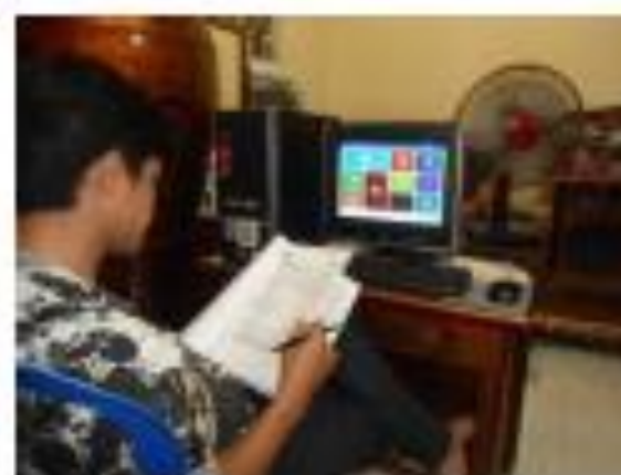
Gambar 5. Pelatihan Penggunaan Zahir Accounting