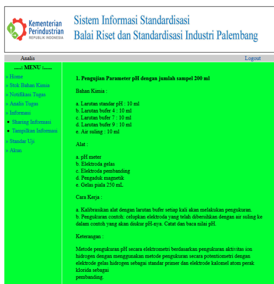
Gambar 2. Halaman Standar Uji Pada Analisis

Dari sekian banyak halaman atau menu yang telah dibuat yang menjadi inti sistem pada sistem informasi laboratorium standarisasi salah satunya adalah halaman standar uji. Halaman standar uji pada analisis adalah halaman yang memuat tentang standar pengujian parameter di laboratorium pengujian. Adapun yang ditampilkan adalah bahan kimia dan alat yang digunakan, cara kerja, serta hal-hal penting yang harus diketahui analisis. Antarmuka halaman standar uji pada analisis dapat dilihat pada Gambar 2 dibawah ini :