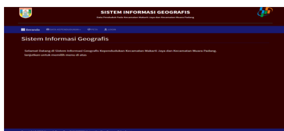
Gambar 1. Halaman Home

Halaman ini merupakan halaman utama yang otomatis akan tampil ketika user membuka aplikasi. Tampilan halaman ini dapat dilihat seperti gambar dibawah ini: