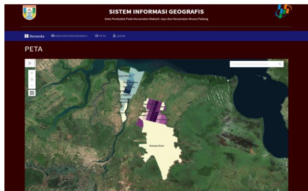
Gambar 3. Halaman Peta

Halaman ini menampilkan visualisasi peta yang sudah didigitasi menggunakan metode choropleth dengan terkoneksi ke web Arc Online.