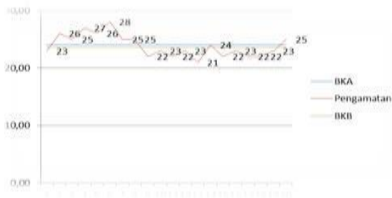
Gambar 4.1 Peta Kendali Pengukuran Kerja Multiriff