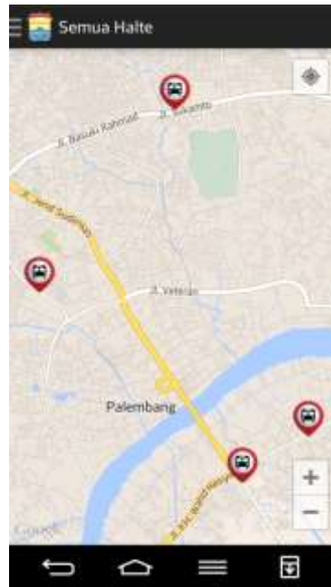
Gambar 4. Halaman Sebaran Halte