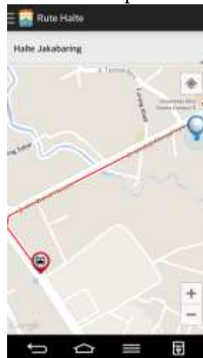
Gambar 5. Halaman Rute Halte

Halaman rute halte merupakan halaman yang digunakan untuk menampilkan rute perjalanan berdasarkan lokasi pengguna dan ke tujuan yang dipilih. Pada halaman ini pengguna dapat melihat arah perjalanan yang akan ditempu. Rute perjalanan tersebut dibuat berdasarkan titik GPS pengguna aplikasi pencarian halte BRT transmisi Palembang. Pada gambar 5 berikut terlihat tampilan hasil pencarian rute perjalanan.