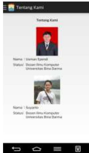
Gambar 6. Halaman Tentang Kami