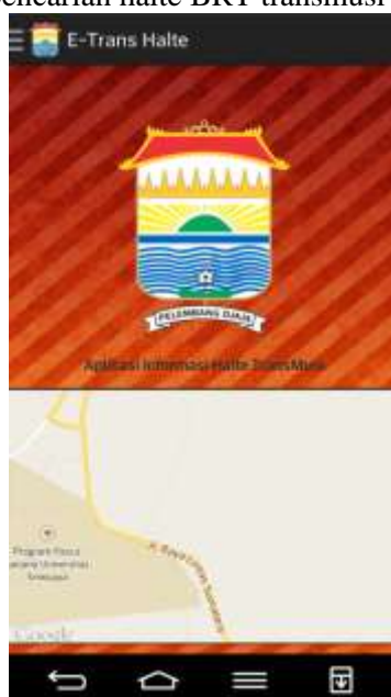
Gambar 3. Halaman Utama Aplikasi

Halaman utama adalah halaman pertama kali yang diakses oleh pengguna aplikasi. Pada halaman utama berisikan peta dan logo kota Palembang. Pada gambar 3 terlihat halaman utama dari aplikasi pencarian halte BRT transmusi Palembang.