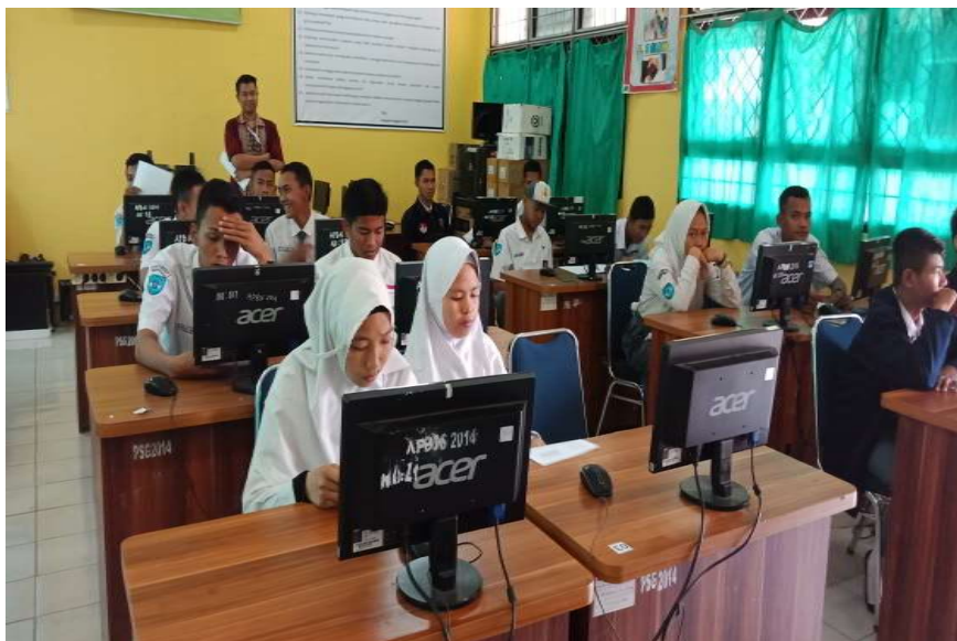
Gambar 4. Kegiatan Penjelasan Penggunaan Sistem Nextcloud

Sistem layanan private cloud computing yang telah dirancang dan dibangun akan dilakukan uji coba kelayakan sistem pada mitra sekolah seperti pada gambar 4 dan gambar 5. Uji coba yang dilakukan pada SMK Negeri 1 Indralaya Utara berjalan dengan baik, dimana guru dan siswa sangat bersemangat dalam mengikuti kegiatan Program Kemitraan Masyarakat (PKM) yang bertema tentang layanan private cloud computing dengan sistem nextcloud . Pada SMK Negeri 1 Indralaya Utara kegiatan uji coba layanan private cloud computing yang dilakukan berjalan dengan baik dimana siswa dan siswi sangat cepat memahami dalam menggunakan sistem nextcloud yang telah di implementasikan pada jaringan laboratorium komputer sekolah, sehingga uji coba sistem layanan private cloud computing pada mitra sekolah dilakukan dengan sukses di laboratorium komputer sekolah.