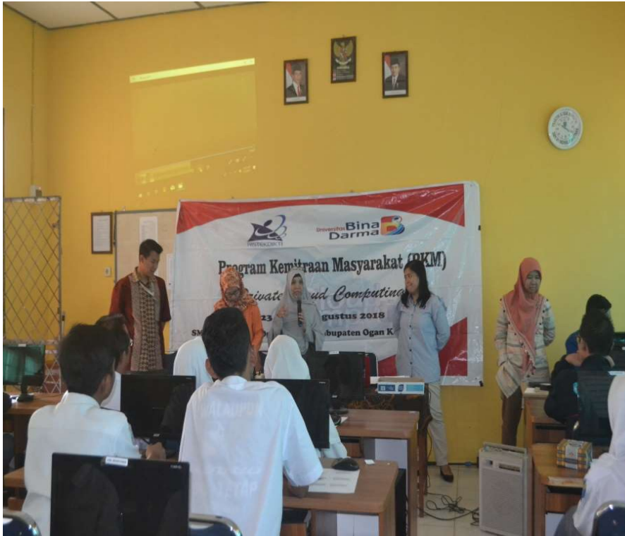
Gambar 5. Kegiatan Praktik Penggunaan Sistem Cloud Computing