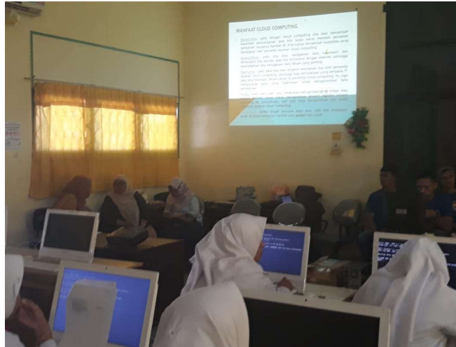
Gambar 1. Kegiatan Penjelasan Teori Cloud Computing