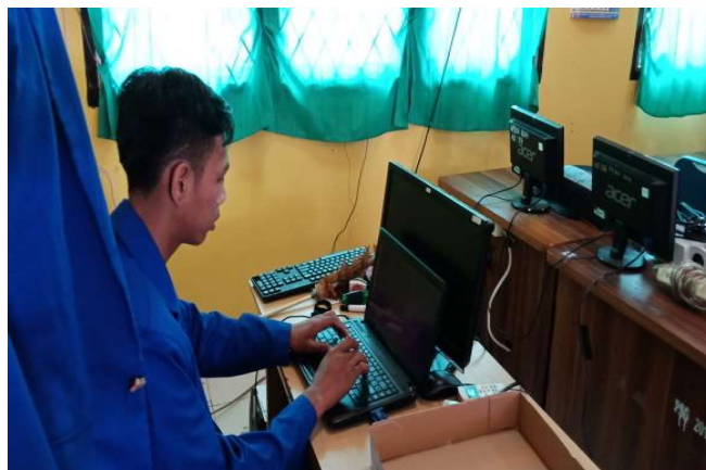
Gambar 2. Kegiatan Instalasi dan Konfigurasi Sistem Nextcloud

Pada tahap selanjutnya seperti pada gambar 2 adalah melakukan kegiatan instalasi sistem nextcloud yang akan digunakan pada kedua mitra sekolah, yang mana sistem cloud computing ini akan diinstal pada komputer server pada mitra sekolah yang telah terinstall sistem operasi linux Ubuntu 14.04 server.