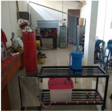
Gambar 3. Rangkaian Alat Pyrolisa Di Lab Teknik Industri Universitas Bina Darma

Dalam penelitian ini plastik yang digunakan berupa plastik kemasan air minum yang berupa (botol dan gelas plastik), yang merupakan senyawa polypropilene sebanyak 2 kg, kemudian dipotong potong 1-2 cm, agar memperluas kontak dengan pemanas. Plastik yang merupakan senyawa polimer yang bersifat transparan dan fleksibel, juga mempunyai kekuatan bentuk dan kekuatan sobek yang baik.