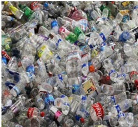
Gambar 1. Limbah botol plastik

Air minum kemasan banyak tersedia untuk memenuhi kebutuhan akan air minum yang sehat, sebagai sumber air mineral yang sangat dibutuhkan oleh tubuh dalam kondisi apapun, tetapi pada umumnya orang kurang disiplin memperhatikan lingkungan karena setelah airnya habis kemasan dibuang sembarangan. Menurut Kementerian Lingkungan Hidup (KLH), setiap hari penduduk Indonesia menghasilkan 0,8 kg sampah per orang atau secara total sebanyak 189 ribu ton sampah/hari. Dari jumlah tersebut 15% berupa sampah plastik atau sejumlah 28,4 ribu ton sampah plastik perhari (Fahlevi, 2012).